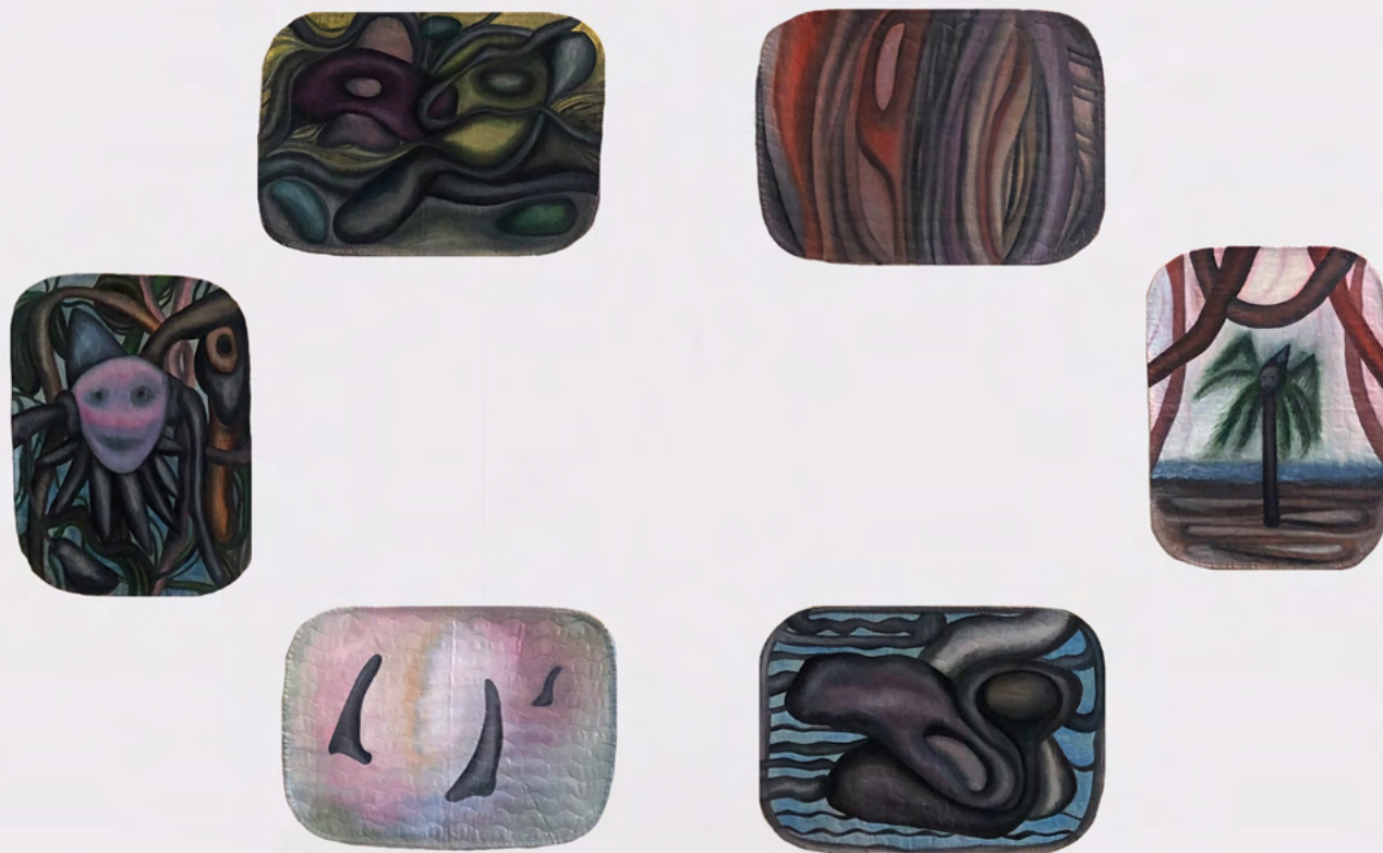
BLEICHES TIER, 2026 Öl auf 6 Tischsets je 33cm x 46cm