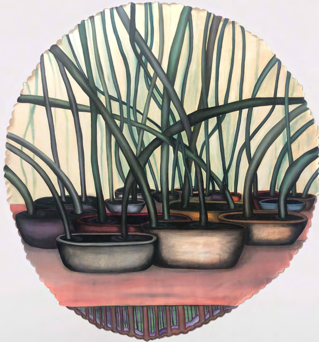
TISCHLEIN DECK DICH 2, 2025 Öl auf Tischdecke 150cm x 170cm