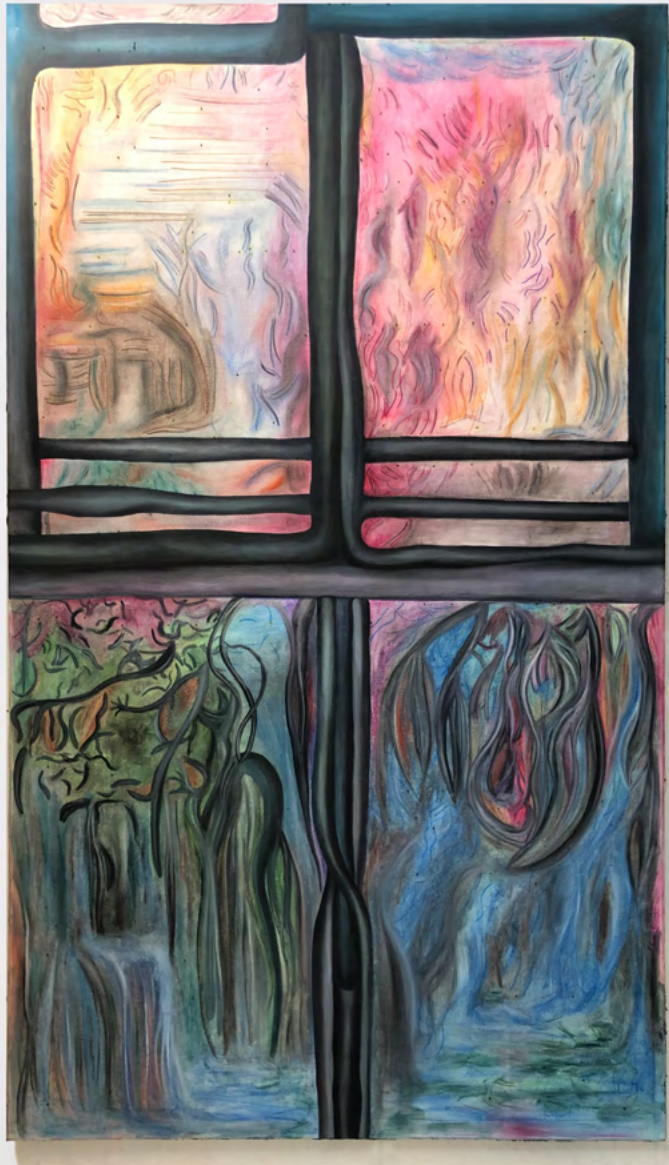
(ALTER) SOMMERTRAUM, 2025