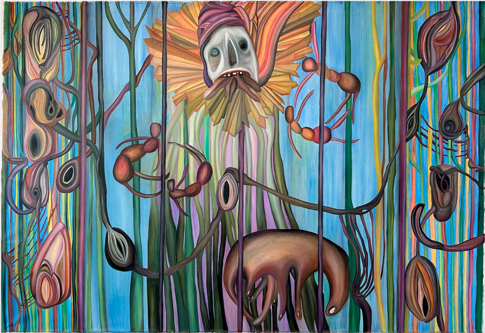
IM BACH ERTRANK DER TAG, 2024